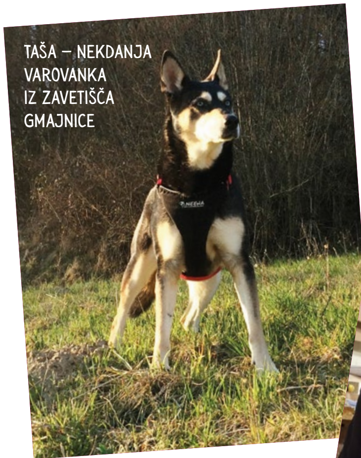
TAŠA – NEKDANJA VAROVANKA IZ ZAVETIŠČA GMAJNICE